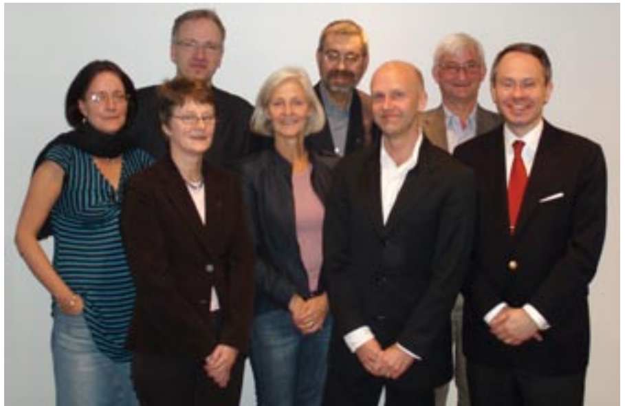
Styrelsen i Sveriges Ögonläkarförening.

Så till styrelsearbetet. Under hösten arbetade delar av styrelsen intensivt med den nya målbeskrivningen. För våra yngre doktorer blir formaliserad utbildning under