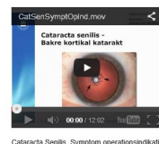
Cataracta Senilis, Symptom operationsindikationer

Anders Behndigs videoföreläsningar från ST-kursen Linsens sjukdomar och Refraktiv kirurgi