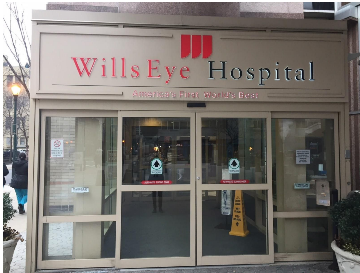
Entrén till Wills Eye Hospital.